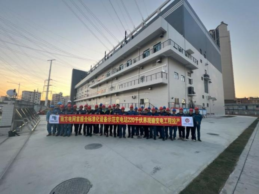
220千伏界观(大沥)输变电工程

2025年8月，中国电力建设企业协会正式公布2025年度中国电力优质工程奖评审结果。广州电力工程监理有限公司参建项目表现卓越，共斩获7项大奖。其中，1项主网工程荣膺“2025年度中小型电力优质工程奖”，6项配网工程摘得“2025年度配电网优质工程奖”桂冠。