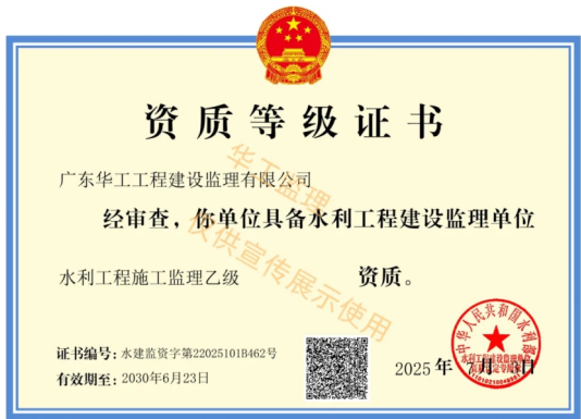
广东华工工程建设监理有限公司

站在新的起点上，公司将满怀信心与激情，以专业铸就品质，以服务赢得信赖，续写华工监理辉煌篇章！