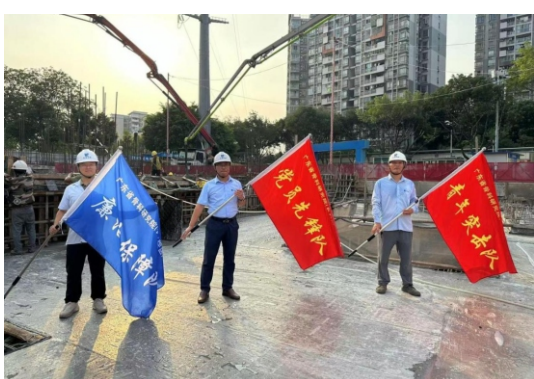
广州市东建工程建设监理有限公司