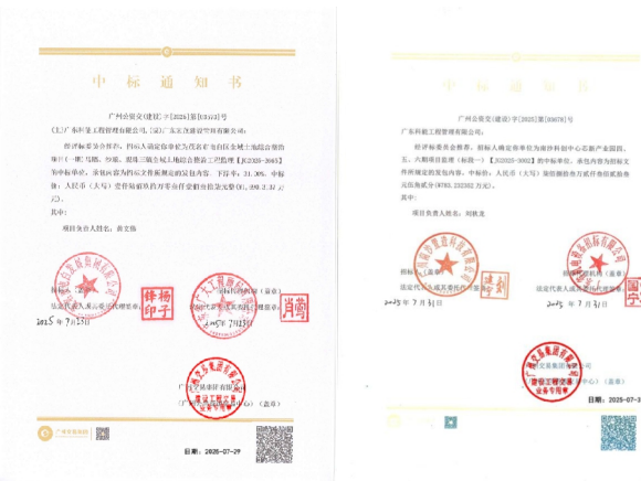
广东科能工程管理有限公司

广东科能工程管理有限公司将以此为契机，继续秉持高度的社会责任感和专业精神，选派精锐团队，投入优势资源，以卓越的工程监理服务，确保两个项目均成为经得起时间考验的精品工程、样板工程和放心工程，不负业主所托，为国家的城乡发展与科技进步持续赋能！