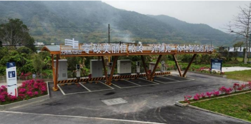
广州供电局美丽乡村智能微电网系列工程

中国电力优质工程奖是电力工程建设领域的“奥斯卡奖”，是中国电力行业工程质量领域的最高荣誉。该奖项由协会组织权威专家严格评审，授予在工程设计、管理、质量、技术、节能环保及施工工艺等方面均达到国内同期、同类工程顶尖水平的项目，是对工程综合建设实力达到行业领先的权威认证。