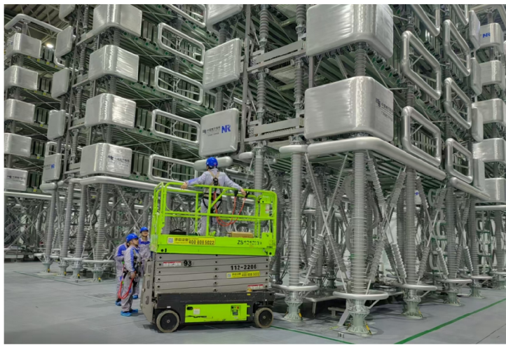
图3:阀厅安装示意图

在项目准备阶段，监理团队靠前服务，践行“前期介入、全程赋能”的理念，深度参与项目前期规划、施工设计审查、直流设备技术方案冻结、场地整理等关键环节，以专业视角提前规避潜在风险。值得注意的是，项目所在地块承载着深厚的能源建设历史——曾建成广东省首个220千伏变电站，也是广州局内建筑面积最大的电力园区，如今亦是广州十五运会重要配套电源点；同时，该区域属于溶洞多发区，地下管线复杂，给工程建设带来多重挑战。面对这一复杂环境，监理团队以高质量监理为核心，在柔直桩基础、阀厅钢结构、换流变设计等方案审查中，技术顾问依托西电东送、中通道等重大项目积累的直流工程管理经验，提出优化建议，从源头夯实设计质量；针对地下管线迁改，监理项目部牵头建立“多方协同摸查-规范技术交底-全程旁站监督”的闭环管控机制，精准把控每一个安全节点，提前消除隐患，保障场地按时移交施工，以“毫米级”管控践行国家工程质量标准。