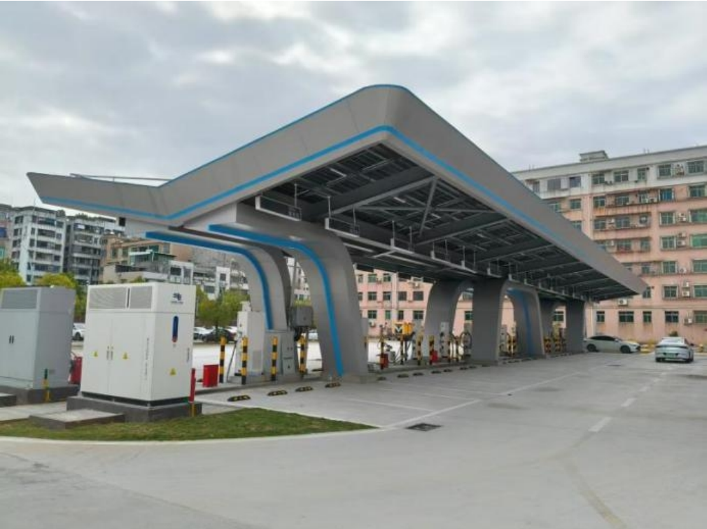
广州供电局多元智能超充站系列工程

中国电力优质工程奖是电力工程建设领域的“奥斯卡奖”，是中国电力行业工程质量领域的最高荣誉。该奖项由协会组织权威专家严格评审，授予在工程设计、管理、质量、技术、节能环保及施工工艺等方面均达到国内同期、同类工程顶尖水平的项目，是对工程综合建设实力达到行业领先的权威认证。