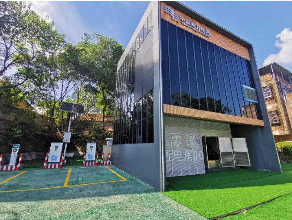
广州供电局零碳配电房系列工程