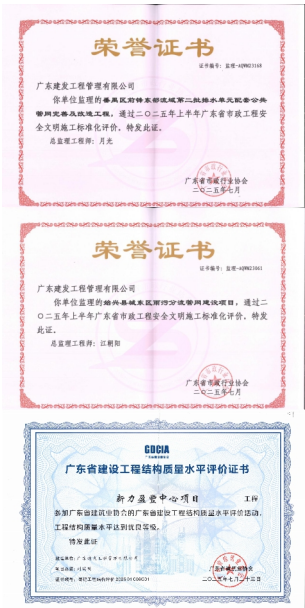
广东建发工程管理有限公司

感谢上级领导及社会各界人士对我司的关爱和支持，我司全体员工将会更加努力，发挥自身的专业技术之长，为业主、为国家的建设项目提供更多价值，争创更多精品、优质工程，为公司争取获得更多荣誉。