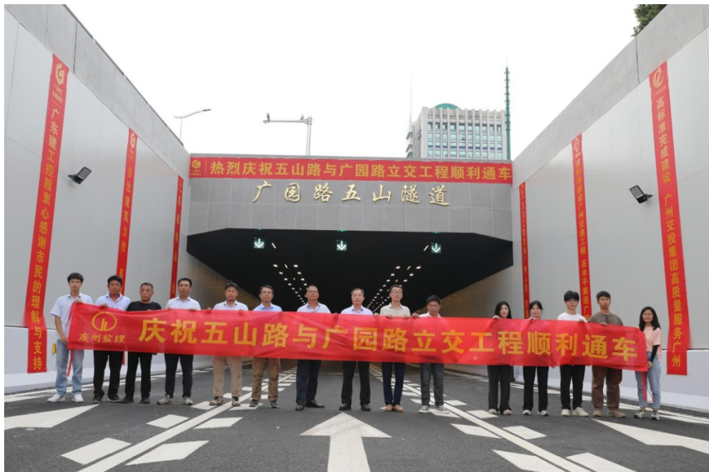
广州市广州工程建设监理有限公司

五山路与广园路立交工程的部分通车，标志着广州交通建设再迈坚实一步，更为第十五届全国运动会的交通保障体系注入关键支撑。项目监理部秉持“铸就精品 奉献价值”的企业理念，不断提升监理服务水平，为赛事期间城市交通的平稳运行积累了可借鉴的实践范例，充分彰显了我司在服务重大赛事中的责任与担当。