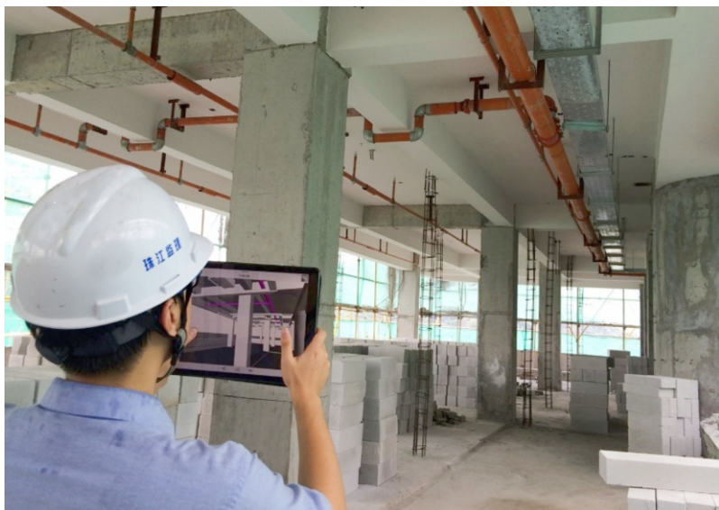
广州珠江监理咨询集团有限公司

从手写日志到数字中枢，从经验依赖到数据驱动，珠江监理将以“智监云库”为支点，为扁平化管理及项目负责制提供基础数据平和智能化应用工具，持续推动企业从“人治经验”迈向“数字智慧”，实现进阶迭代，进而树立监理行业专业化、智能化转型的新标杆，为国有企业在行业标准化建设中取得重要突破贡献“珠实样本”。