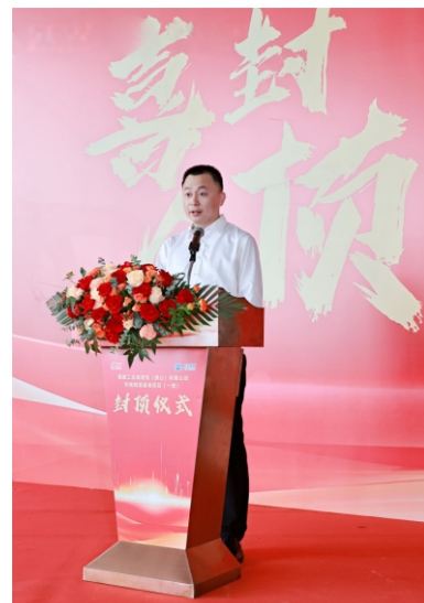
广东重工建设监理有限公司

本次项目封顶为我司高端制造业产业基地业绩再谱新章。公司将以此次为契机，强化技术、精进服务，进一步深耕顺德区域，携手优秀企业打造更多精品工程，助力区域经济高质量发展。