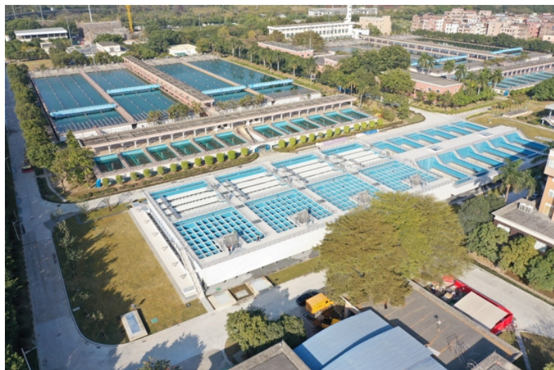
广州市穗高工程监理有限公司

我司监理团队自进场以来，始终秉承“严格监理，优质服务，科学公正，廉洁自律”的方针，全面履行监理职责，项目在整个施工过程中多次获得广州市水务工程质量监督站和公司的高度好评，被列为标杆工程，多次邀请其他施工单位前来观摩学习。