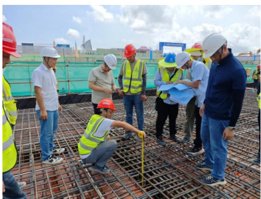
广州市东建工程建设监理有限公司