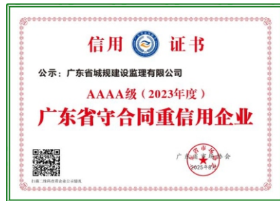
广东省城规建设监理有限公司