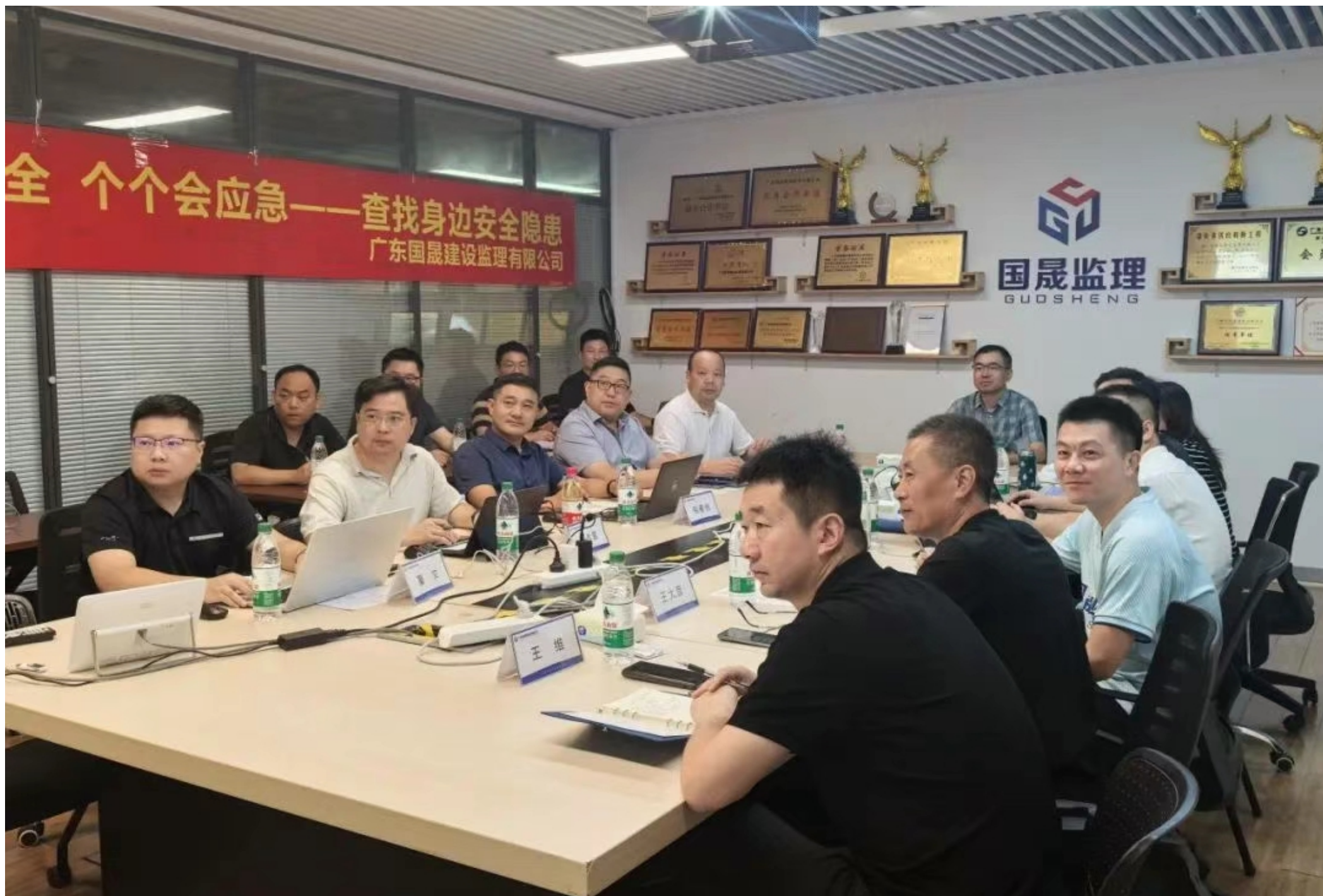
广东国晟建设监理有限公司

本次半年度工作会议是一次总结成绩、研判形势、部署任务、凝聚共识的重要会议。目标已明确，号角已吹响。全体国晟人将牢记“一体化保交付，市场化谋发展”的核心主题，以更加坚定的信念、更加昂扬的斗志、更加务实的作风，保持良好状态，做好充分准备，共同努力，一起完成全年的目标！