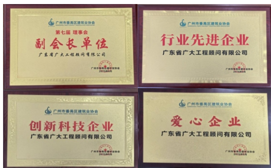
广东省广大工程顾问有限公司