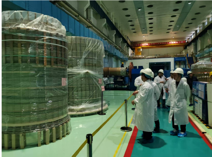
图4:换流变监造示意图

随着各参建单位陆续进驻，监理团队进一步深化高质量监理管理实践：围绕施工流程优化、风险节点预判等核心环节，向建设单位提出20余项专业建议；创新建立“问题响应-方案论证-执行跟踪-效果评估”的全链条闭环管理机制，通过嵌入式监理组织架构、每周协同报告等制度，实现与建设单位在技术可行性、经济合理性、进度可控性上的深度共识，以“全过程、全要素、全参与”的监理服务模式，为工程建设筑牢专业屏障。这种“资源倾斜+专业赋能+协同管理”的筹备模式，不仅是监理公司在建设一流监理咨询服务能力的生动实践，更彰显了高质量监理管理对国家重点工程的“护航”价值，为后续工程高效实施奠定了坚实基础。