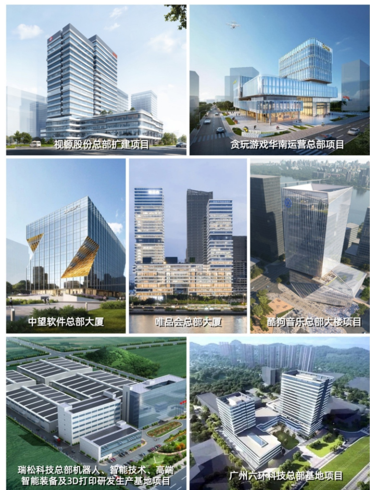
广州宏达工程顾问集团有限公司

宏达顾问集团拥有建设领域全产业链的服务能力，总部办公建筑、高科技产业园区项目是我司的优势业务之一。标杆项目有视源股份总部扩建项目、小鹏汽车智达新能源产业化生产基地、贪玩游戏华南运营总部项目、广州六环科技总部基地项目、瑞松科技总部机器人、智能技术、高端智能装备及3D打印研发生产基地项目、广州粤芯半导体技术有限公司12英寸集成电路模拟特色工艺生产线项目、中望软件总部大厦、三七互娱总部大厦、酷狗音乐总部大厦、唯品会总部大厦、名创优品国际总部项目等。宏达顾问集团始终秉承“为客户承担、使项目增值”的服务宗旨，为客户提供高品质的专业服务，拥有广泛的社会美誉度。