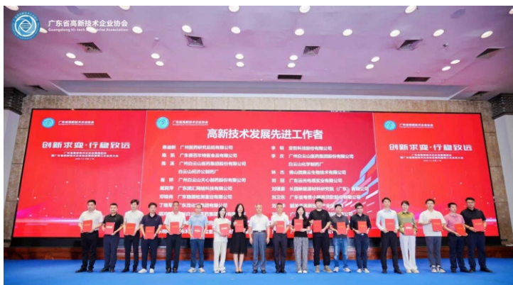
广州宏达工程顾问集团有限公司